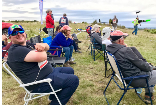
Les gradins improvisés pour profiter du spectacle.

delisme.fr, une ambiance décontractée, sur une localité réputée pour son vent, une équipe rodée, un soupçon de soleil. Ce championnat fera partie des 3 championnats les plus disputés et représentatifs du niveau. Une vraie réussite pour le Club de l'ANEG, pour l'organisation et pour les pilotes.