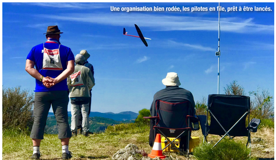
Une organisation bien rodée, les pilotes en file, prêt à être lancés.