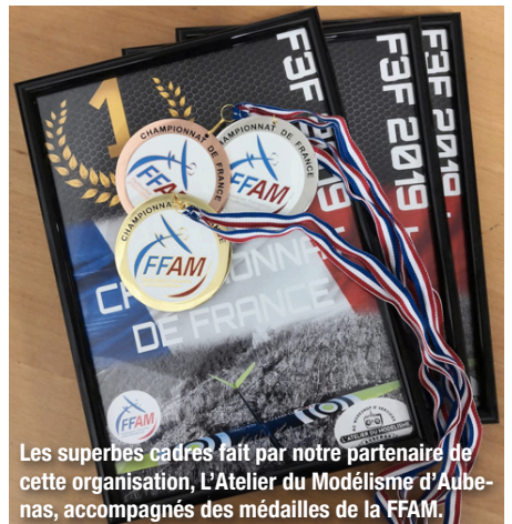
Les superbes cadres fait par notre partenaire de cette organisation, L'Atelier du Modélisme d'Aubenas, accompagnés des médailles de la FFAM.